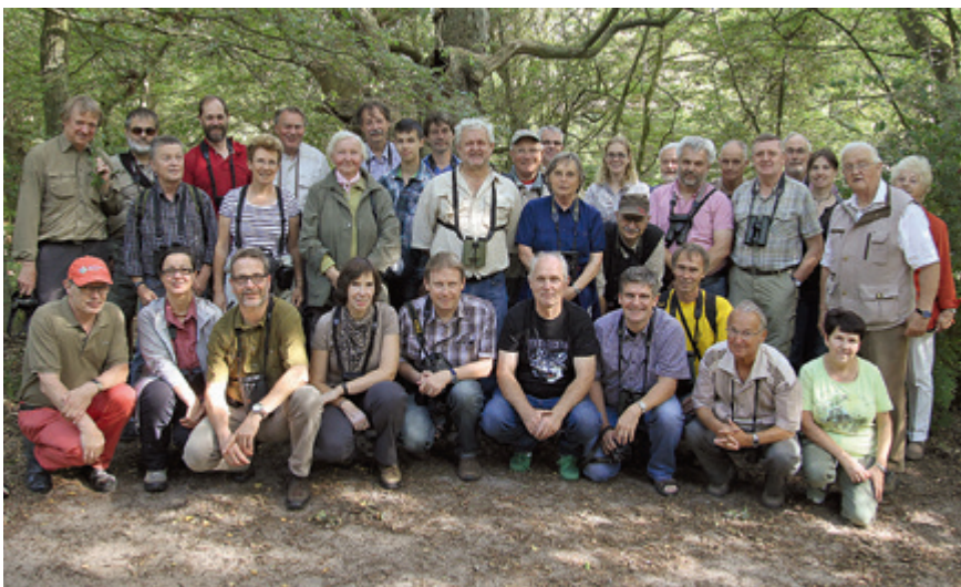
Mit 36 Teilnehmerinnen und Teilnehmern war die Tagung sehr gut besucht.

Für viele Organismengruppen und speziell Vogelarten wurden bereits Anpassungen an sich ändernde klimatische Bedingungen festgestellt. Die meisten Unter-