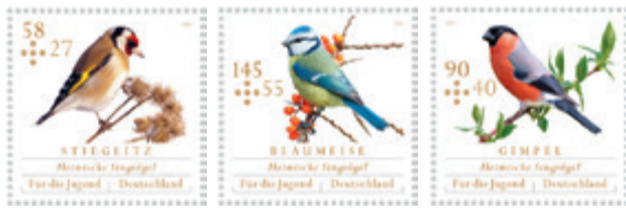
Sondermarkenserie 2013 „Für die Jugend“.

Portraits von Stieglitz, Gimpel und Blaumeise sind die Motive der diesjährigen Sonderbriefmarkenserie „Für die Jugend“. Die von der Grafik-Designerin Julia Warbanow entworfenen Marken rücken die Vielfalt unserer heimischen Vogelwelt in unser Bewusstsein. Der DDA stand bei der Auswahl und Gestaltung der Motive fachlich beratend zur Seite und hat außerdem zusammen mit dem Bund Deutscher Philatelisten an der Erstellung von Unterrichtsmaterialien mitgewirkt, mit denen das Thema der Briefmarkenserie im Grundschulunterricht behandelt werden kann.