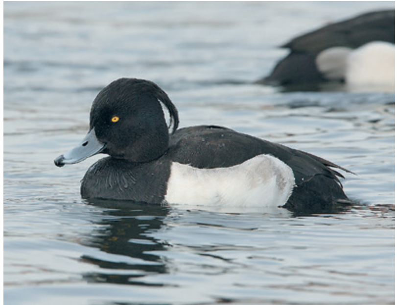
Der Schwerpunkt der Winterverbreitung u.a. der Reiherente hat sich in den vergangenen 30 Jahren in Richtung Nordost verschoben.

Bei einer ähnlichen Untersuchung an überwinternden Limikolenarten in Norwesteuropa stellte ein Autorenteam unter Leitung von Ilya Maclean vor einigen Jahren ebenfalls Verlagerungen im Schwerpunkt der Mittwinterverbreitung fest. Auch bei dieser Studie zeigte sich eine Verlagerung in Richtung der Brutge-