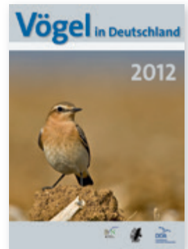
Zugvögel stehen im Fokus der aktuellen Ausgabe von Vögel in Deutschland .