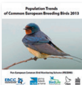
Das Faltblatt „Population Trends of Common European Breeding Birds 2013“ zeigt die aktuellen Bestandstrends von 163 häufigen europäischen Brutvogelarten. Abb.: EBCC

Durchschnittlich haben die Brutbestände aller häufigen Vogelarten über den Betrachtungszeitraum um 13 % leicht abgenommen. Im betrachteten Zeitraum haben die Bestände von 46 Arten zugenommen, 61 zeigen rückläufige und 45 gleichbleibende Trends. Bei elf Arten ist der Trendverlauf unklar. Der auf 39 Arten basierende europäische Indikator für die Agrarlandschaft zeigt für den betrachteten Zeitraum eine Abnahme um 53 %. Stabil (+ 1 %) – wenngleich fluktuierend – zeigt sich der Verlauf des Indikators für häufige europäische Waldvogelarten, der sich auf die Trendentwicklung von insgesamt 33 Arten stützt. Ergänzende Informationen zum Thema „Population Trends of European Common Birds 2012“ sind unter www.ebcc.info abrufbar. Dort steht auch das Faltblatt zum Download bereit.