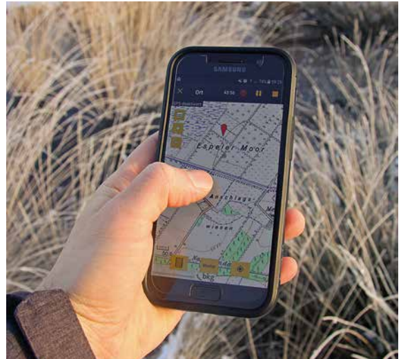
Durch die Weiterentwicklung der App NaturaList sollen bald auch die Brutvögel im Gelände online erfasst werden.