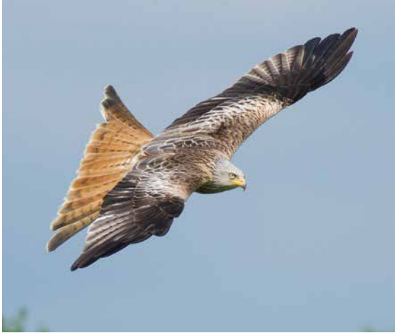
Unser heimlicher Wappenvogel: der Rotmilan.

Horststandorte zu sichern. Um dies zu erreichen, haben sich 2013 der Deutsche Verband für Landschaftspflege (DVL), die Deutsche Wildtier Stiftung und der DDA mit verschiedenen Partnern aus der Praxis zusammenschlossen. Die Partner beraten die Landnutzer über Maßnahmen rotmilanfreundlicher Landbewirtschaftung in neun Modellregionen in insgesamt sieben Bundesländern.